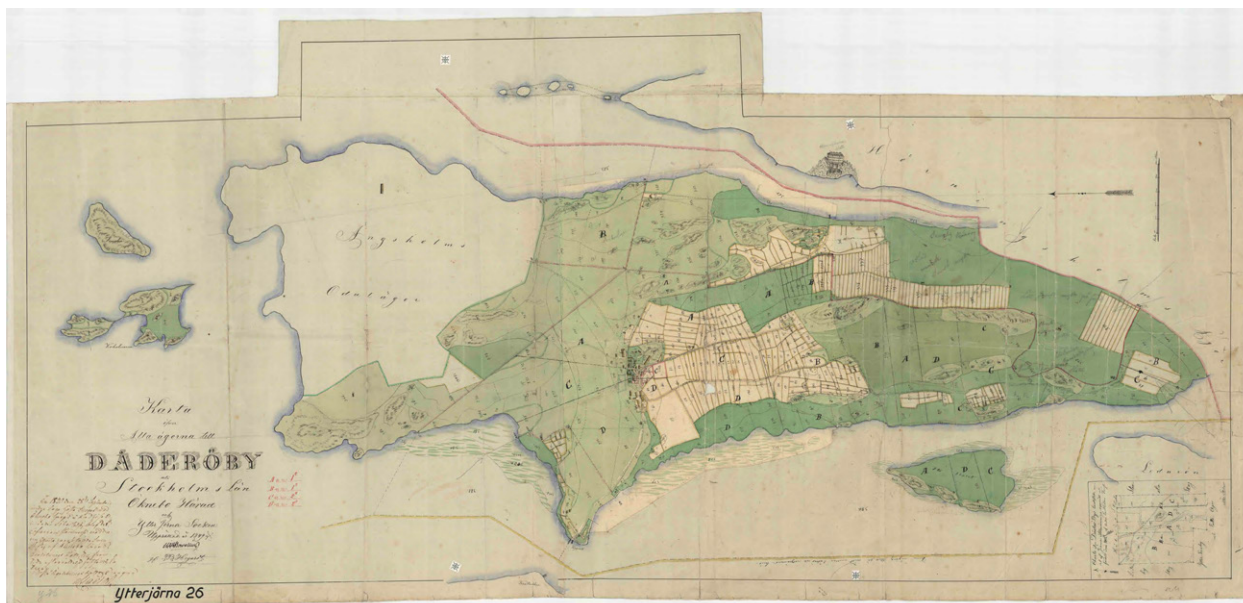
Småskaligt jordbruk och herrgårdsmiljö. Dåderö vid lagaskifte 1850. Karta: Lantmäteriet.