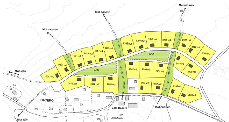
Idéskiss över exploateringsområdet. Tengbom 2017-09-12.