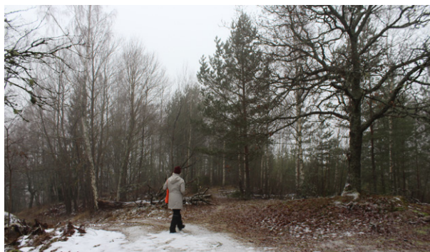
Befintlig väg på åsen (ÖV-riktning). I bakgrunden en upptrampad stig som följer åskammen.