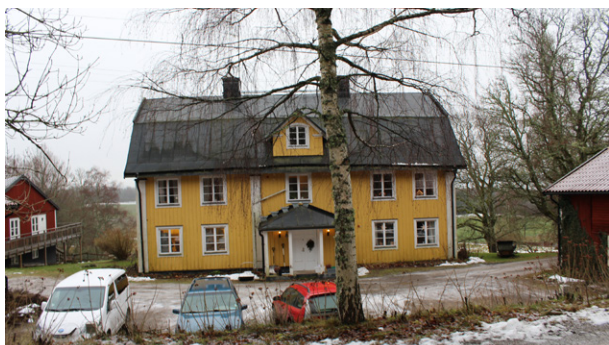
Däderö bys äldsta bostadshus. Mangården har samma läge idag som 1850.