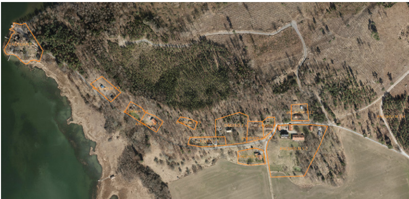
Dåderö by 2018. Tomterna ligger glest utspridda i terrängen, framförallt norr om vägen. Karta: Södertälje kommun 2018.

Bebyggelsen i Dåderö består idag av 13 småhus (inklusive färjtorpet) varav halvparten har utpräglad fritidshuskaraktär. I tillägg finns flera uthus, garage och några äldre ekonomibyggnader. Centralt i byn ligger Dåderös äldsta gård som består av en stor mangårdsbyggnad flankerad av två äldre uthus. Gården är den enda med samma placering som på lagaskifteskartan från 1850. Även bostadshuset på Emgården på norra sidan av vägen är av äldre typ och kan vara flyttat i samband med laga skifte. Två villor i byn har sekelskifteskarak- tär, tre av fritidshusen är av sportstugetypp troligen från 1930- eller 1940-talet. Den övriga bebyggelsen bör ha tillkommit efter 1950-talet och fram till 2010-talet. Vid kulturlandskapsutredningen 2017 registrerades det dessutom flera huslämningar i området som tillhör Dåderö by 1850. Några av dessa ligger på den gamla bytomten, och några vid vägskälet öster om byn.