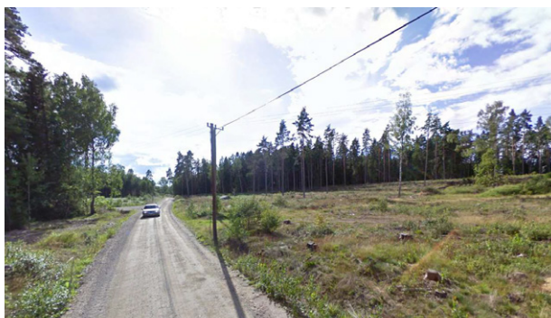
Exploateringsområdets nordöstra del, sett från Engholmsvägen. Bild: Google 2018.