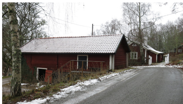
Äldre uthus till mangårdsbyggnaden. Har samma läge idag som 1850.