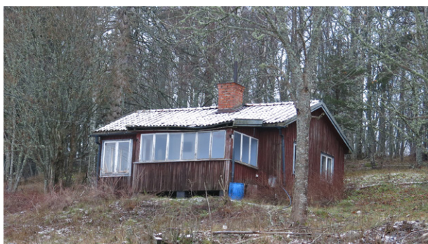
Äldre sportstuga på åsens södra sida.