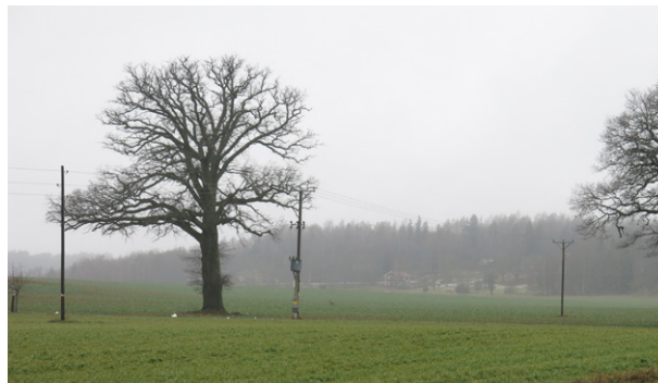
Dåderö by och åsens södra sida. Blick från Borghaga mot nordväst.