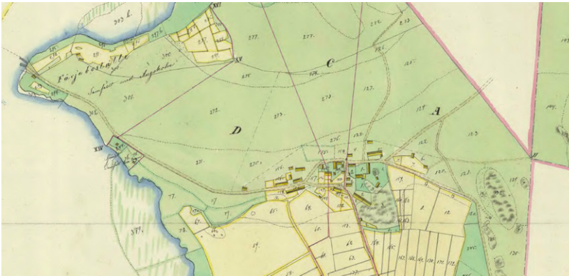
Dåderö by vid laga skifte 1850. Ett stort antal byggnader koncentrerar sig runt bytomten. Karta: Lantmäteriet.