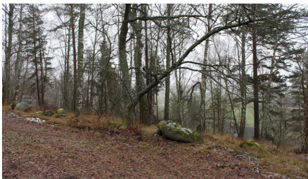
Blick från åsen ut över odlingslandskapet i söder.