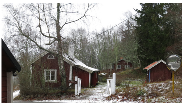
Torpstuga på Emsgården på norra sidan av vägen.