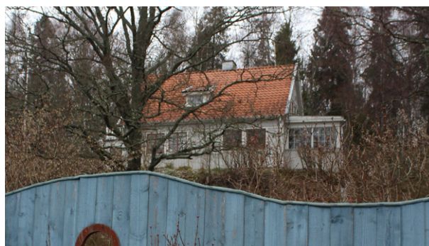
Äldre villa i 1,5 våningar med grå panel och spröjsade fönster. Placerad på åsens södra sida.