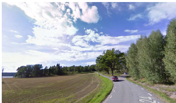
Trekantsytan vid vägskalet. Sett från vest.