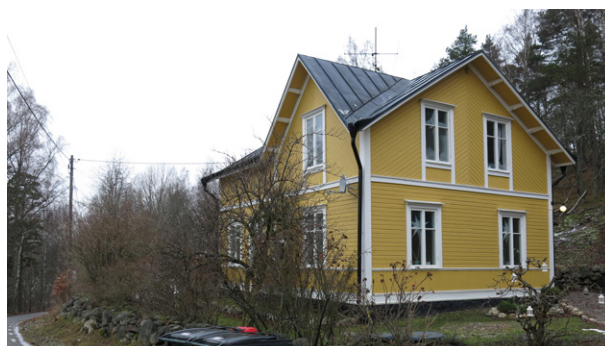
Äldre villa i 1,5 våningar med lekfull panel och plåttak. Placerad på norra sida av vägen.