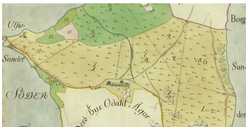
Dåderö by 1783. Byns två gårdar ligger söder om färdvägen till färjeläget och vidare till Nyköping. Den gröna vägen som leder mot norr betecknas på kartan som vinterväg till kyrkan. Karta: Lantmäteriet.

Dåderö by ligger längs halvöns huvudväg (väg 524) som leder från Mörkö över Borghaga till det gamla färjeläget vid Ulvsundet väster om Dåderö by. Söder om byn sträcker sig det öppna jordbrukslandskapet, norr om byn reser sig en skogsbevuxen grusås, byns tidigare utmark. Huvudvägen och färjförbindelsen tillhör den gamla färdvägen från Nyköping över till Dåderö, Engsholms slott och Borghaga, och vidare till Mörkö. Huvudvägen förlorade sin betydelse som viktig färdled när färjförbindelsen ställdes in 1985, men färjkarltorpet och bryggan vid Ulvsundet är bevarade och vittnar om vägens historiskt infrastrukturella funktion. I ett vägskäl öster om Dåderö by skapas en stor, delvis trädbbevuxen trekantig yta där tre vägar från Dåderö, Engsholms slott resp. Borghaga möts. Dessa tre vägar har i stort samma sträckning som på avmätningsskartorna från 1692 och 1783. På en karta från 1783 syns ytterligare en väg som sträcker sig som en båge från vägskälet upp över åsen och vidare mot väster där den slutar i viken norr om färjeläget. Vägen betecknas på kartan som vinterväg till kyrkan. Den syns fortfarande tydligt på ekonomiska kartan från 1959, men ersattes troligen i samband med etableringen av grustäkterna på åsens norra sida av den nuvarande bruksvägen som drogs lite väster om den historiska kyrkvägen. Vid kulturlandskapsutredningen 2017 registrerades det dessutom en äldre väg längs åsens krön (ca 300 meter lång Ö-V riktning).