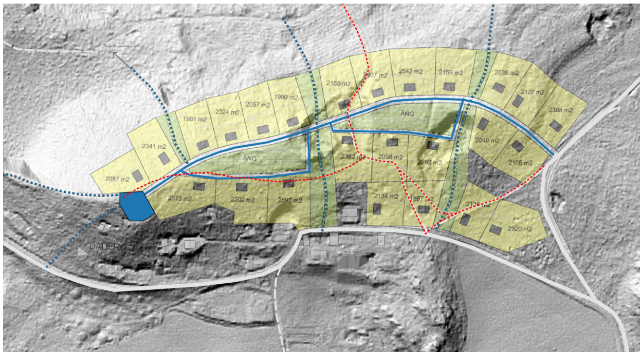
Exploateringsområdet enligt Tengboms första idéskiss. Röda linjer: Vägar som enligt förslaget ska tas bort. Blåa linjer: Nya vägar. Bakgrundskarta: Lantmäteriet 2018.

Idéskissen föreslår en regelbunden tomtindelning, med tomtstorlekar på ca. 2000 m 2 - 2500 m 2 och med småhusen uniformt placerade ut med vägarna. På norra sidan av åskränet visar idéskissen en rad med upp till 13 tomter. På södra sidan är det tänkt att tomterna placeras både ovanför byns befintliga bebyggelse samt utmed väg 524 öster om fastigheten Ängsholm 5:12.