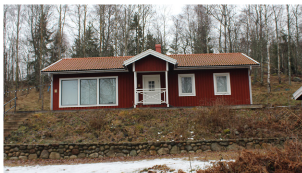
Nybyggt fritidshus på åsens södra sida.