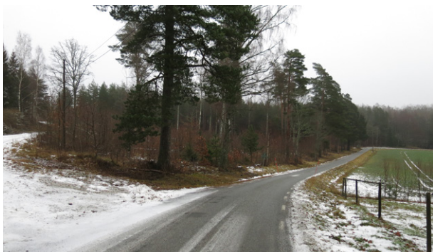
Trekantsytan vid vägskalet. Sett från Dåderö by. Blick mot öst.