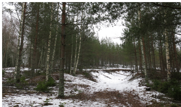
Grustäkt på norra sidan av åsen.