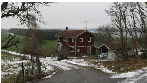
Nyare villa i två våningar söder om vägen.