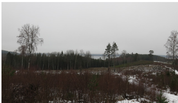
Norra sidan av åsen med barrskog och kalhyggen. Blick från åsen mot nordväst.

Den ganska uniforma tomtindelningen som presenteras i idéskissen saknar emellertid Dåderö bys variationsrikedom. Det mest känsliga området i exploateringsplanen är själva vägskälet/trekantsytan öster om byn, som har höga kulturhistoriska värden och utgör en viktig vy för de som närmar sig Dåderö by från Borghaga och Engholms slott. Bebyggelse på denna plats avråds. Idéskissen bör dock inte betraktas som annat än just ett första utkast för att kunna lämna in ansökan om planbesked.