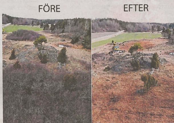
Kulturlandskapet får ett nytt ljusare och luftigare utseende när spindelgrävaren rensat bort ogenomträngliga buskage av slån. Nu ges annan växtlighet en chans att slå rot. I bakgrunden skimtar torpet Tegneby.

- En förutsättning för att finansiera det här projektet - och den fiber och det VANÄT som dras på Mörkö - är att vi sålt en del fastigheter och möjliggjort en exploatering av cirka 25 tomter på norra Mörkö, mellan Däderö och Ångsholm.