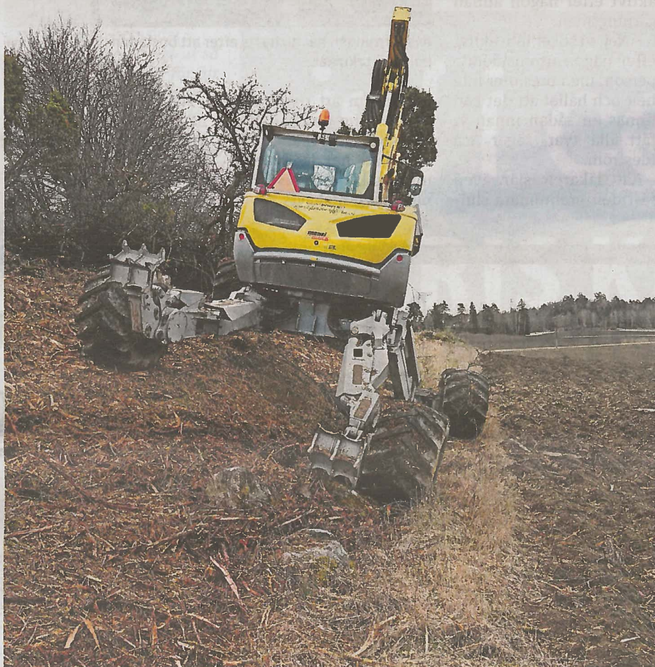
Spindelgrävaren tar sig fram nästan överallt.